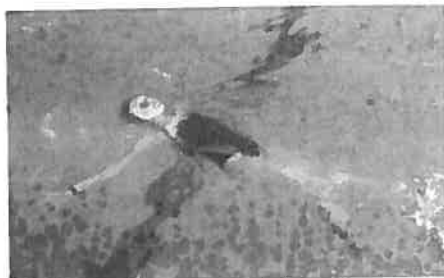
Réagir au signal pendant un déplacement et trouver une position d'équilibre.