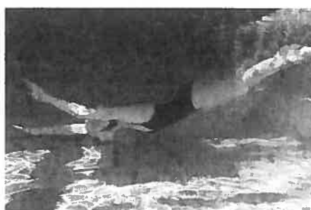
S'immerger pour franchir un obstacle.