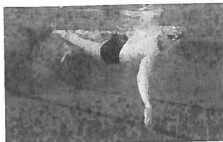
Gérer ses ressources pour regagner le bord.