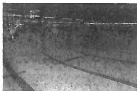
Entrer dans l'eau en chute arrière pour témoigner du contrôle de ses émotions