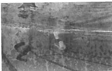
Maîtriser des changements de direction et d'orientation.