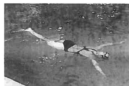
Réorganiser ses appuis et son équilibre en déplacement puis lors d'un surplace.